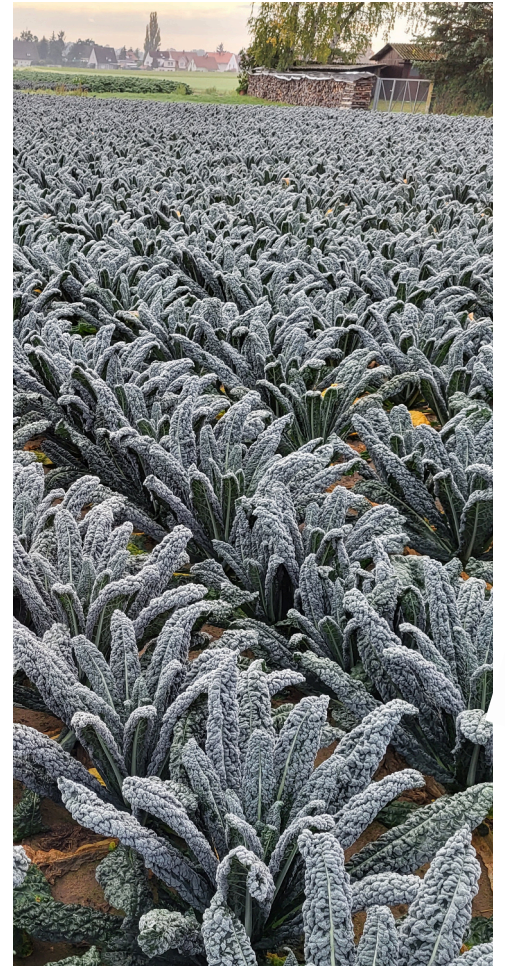
ANBAUSCHEMA FÜR DIE PRODUKTION VON PALMKOHL, CAVOLO NERO